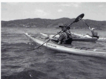
▲シーカヤックのイベントも企画しています

みなさんがご利用しやすいように努めているつもりですが、知られていない仕事もあるかもしれません。ここでは、毎月各課の仕事の内容を紹介します。第五回目は、商工水産課です。