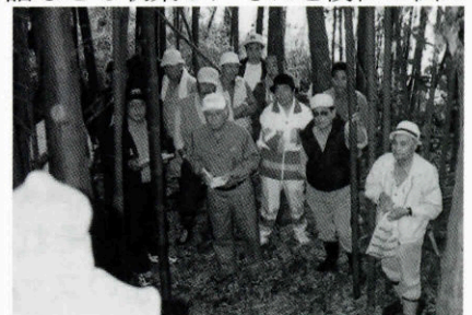
▲王屋敷遺跡での学習

※「重藤の弓と矢」については、後日「油谷のささやき」(油谷町郷土文化会発行)で発表します。