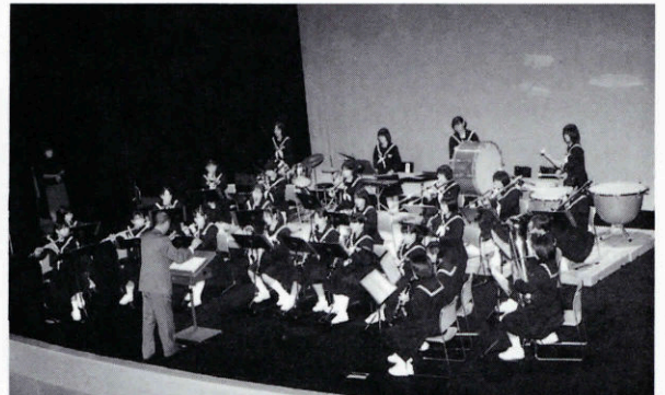
▲県内でトップクラスの菱海中学校吹奏楽部