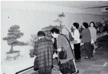
▲どれもすばらしい作品です！