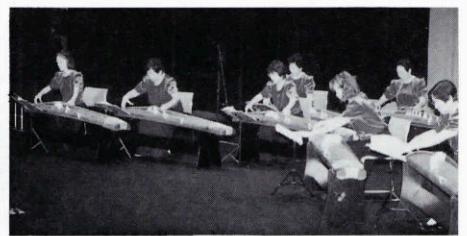
▲日頃の成果を発揮されました