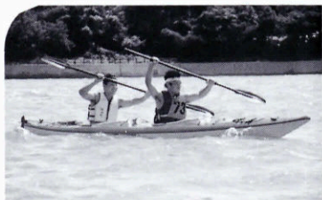
▲息を合わせてゴールを目指す