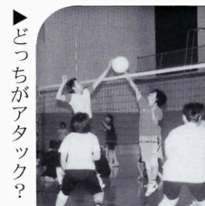
▶どっちがアタック?