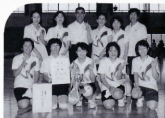
▲Bブロック優勝 東大坊チーム