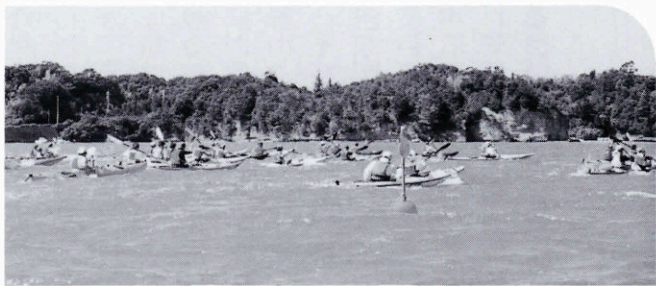
▲荒波を気にせず元気にスタート