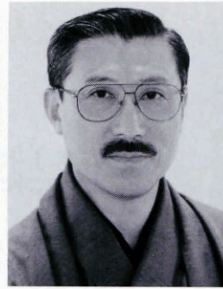
【中島誠之助プロフィール】

TV「開運!なんでも鑑定団」でお馴染みの鑑定士。古伊万里染付の値段に広め「伊万里染付の値段を決める男」と呼ばれる。