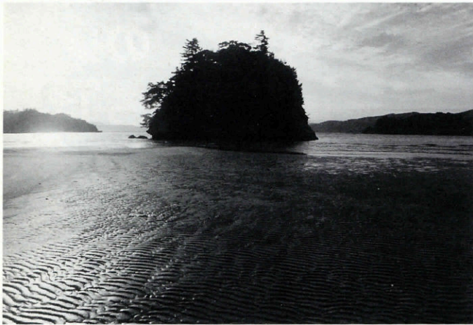
ぎょうとうじま 行堂島

その昔、行をしていた山伏がこの島で死んだことから「行とうじ島」と呼ばれるようになったということです。干潮の時はYYビーチから歩いて渡ることができ、広い砂浜には美しい波紋が見られます。