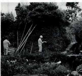
町内危険箇所巡視(5月)