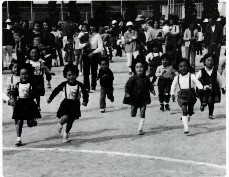
明日を担うよい子たち