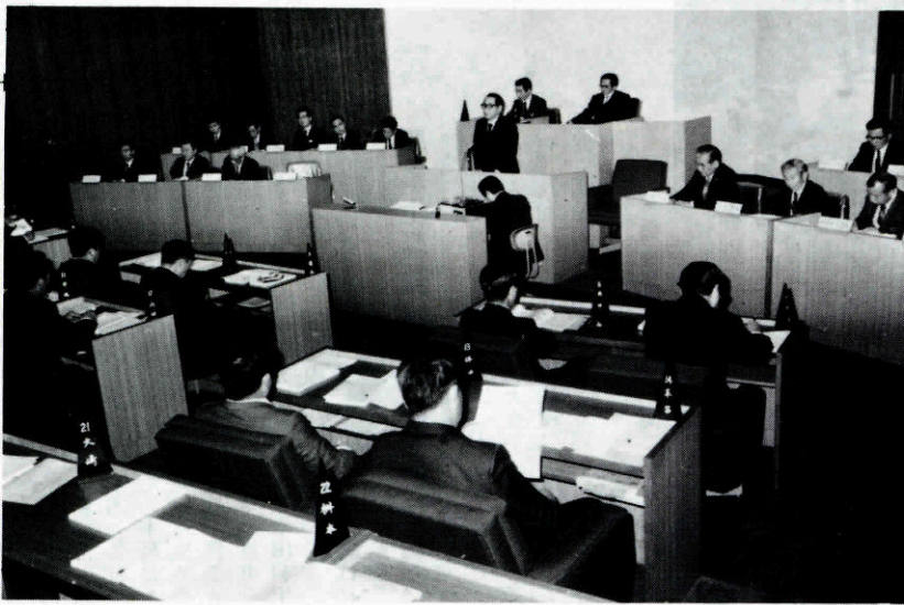
新年度の施政方針 を述べる松永町長