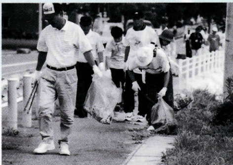
平成14年8月3日『道の日』道路清掃状況