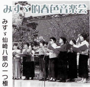
オーシャンコールながと

みすゞ仙崎八景の一つ極楽寺では、野外特設ステージが設けられ、和太鼓や合唱など「みすゞ的春色音楽会」が開かれ、仙崎小の児童たちがみすゞの詩を朗読し、司会進行もつとめました。