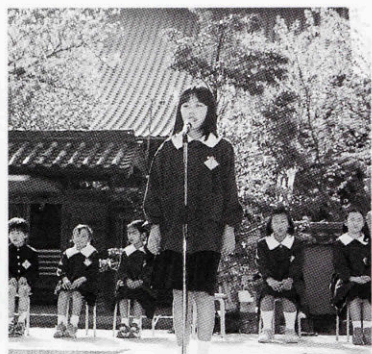
司会と詩の朗読を行った仙崎小児童