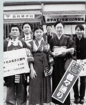
服装もレトロに…昔々通り