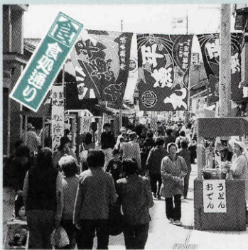
長門の食が満載 食処通り