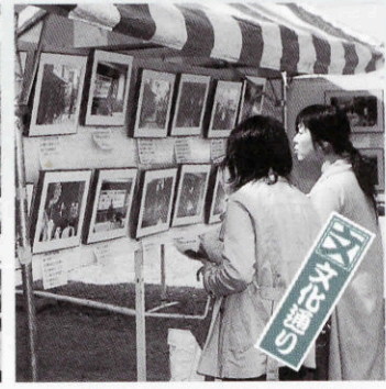
みすゞ関連の作品を展示した文化通り