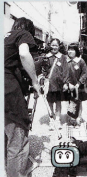
ほっちゃんTVも取材