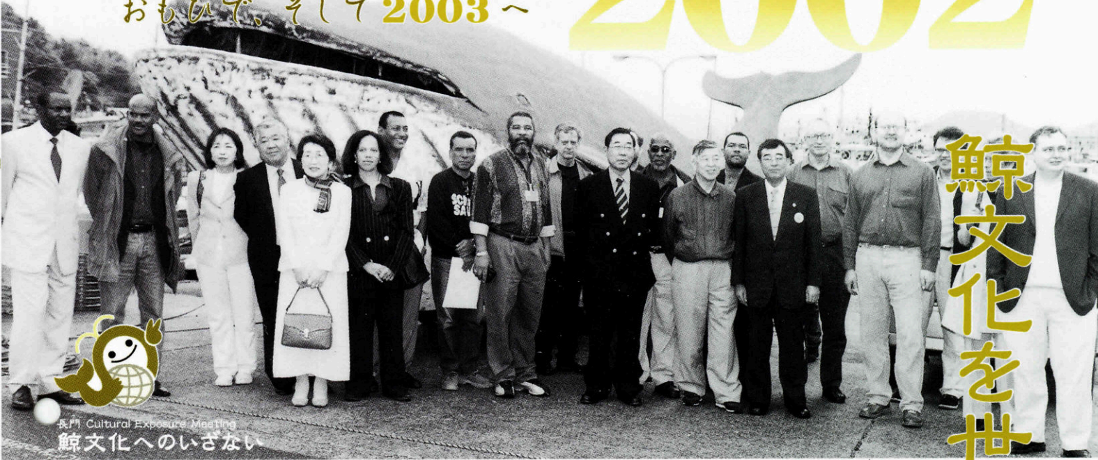
長門 Cultural Exposure Meeting 鯨文化へのいざない

4月25日から5月24日まで、下関市で国際捕鯨委員会（IWC）が開催され、長門市でも「第1回日本伝統捕鯨地域サミット」や「鯨文化へのいざない」などの関連イベントを開催して、長門に息づく「鯨にやさしい文化」を国内外に情報発信しました。