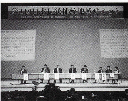
第1回日本伝統捕鯨地域サミット

会議では、学識者による講演や各地に伝わる捕鯨文化の紹介、パネルディスカッションなどが行われ、最後に人と鯨の在り方を世界に問う「長門宣言」が満場一致で採択されました。