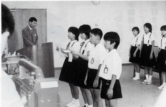
健康福祉子供探偵団任式(県庁にて)