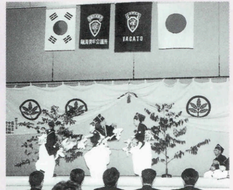
▼小・中学生による神楽舞

8月23日、ルネッサなごで日韓親善交流20周年記念式典が開催されました。式典では、20年間の交流事業活動の思い出などが報告されました。アトラクションでは、小・中学生による演奏・神楽、鎮海市による中学生の農楽が披露されました。