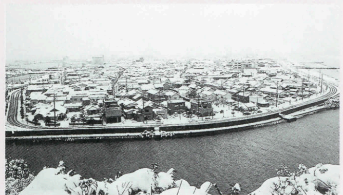
▲王子山から撮影した仙崎の様子