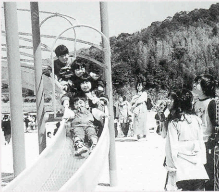
▲全長128メートルの「ローラーすべり台」

3月26日、長門市総合公園児童コーナーに新しい遊具「ローラーすべり台」が完成しました。このすべり台、全長128メートルで県内では和木町に次ぐ2番目の長さとのこと。式典後、子供たちは早速初すべりを楽しみました。