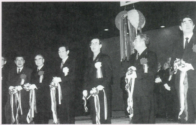
▼劇場前で行われたテープカットの様子

3月4日、長門市総合公園内にオープンした「ルネッサながと」。オープンを記念して、文楽・歌舞伎の公演やVリーグの入れ替え戦なども行われ、たくさんの方で賑わいました。