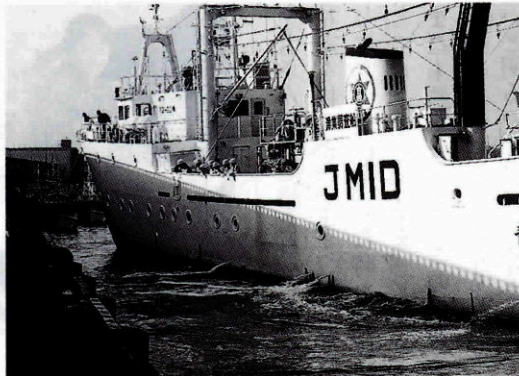
▶日12年10月下関港から出港する実習船青海丸

団生活の中では、自分のことも大切だと思うけど、周りの人の事を考えることの大切さが非常に良くわかりました。