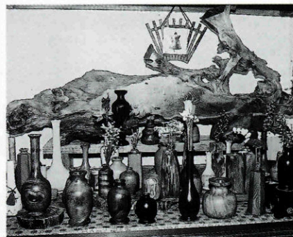
▲「趣味のやかた」での作品

きっかけをお聞きすると、「平成10年頃テレビで、阿武町宇生賀地区で、埋もれ木(杉の根)を無料で、と言う放送を見たのが最初。作品は、埋もれ木・雑木で一輪差し、コップ、ひょうたん、花台など年間30個位製作しています。大変に思うことは、木を良く乾燥させないと、ひびが入ったり、腐っていたりする