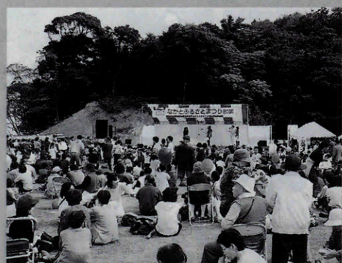
▲ステージ周辺はたくさんの人でにぎわいました

●住宅金融公庫の住宅債券「つみたてくん」を「ご存じですか?」 安全確実に自己資金を増やせる上に、積立者だけの加算融資等の特典もあります。 ●問い合わせ 住宅金融公庫中国支店 ☎082・221・8716