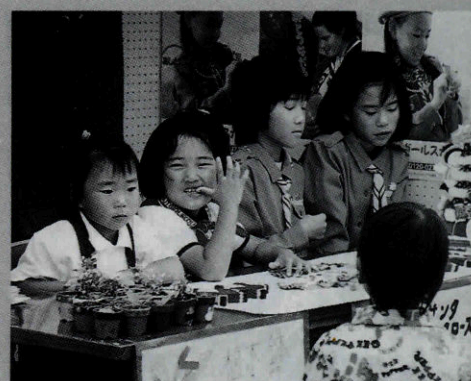
▲いらっしゃいませ