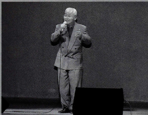
▲カラオケ大会の様子