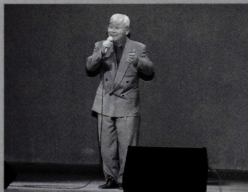
▲カラオケ大会の様子