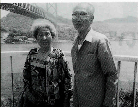
▲喜寿祝いに妻と旅行に出かけたときの1枚

んか好きです。それにお酒、1日3合は呑みます。漁に行く前に景気付けに呑むのが一番。健康については、風邪をひいたことがなく、いたって健康、前日の晩酌で体調が悪い時は、漁は休みます。あくまでも、マイペースで無理をしません。歳を取るほど夫婦のありがたさが、よくわかります。」と言われました。