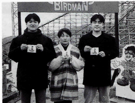
▲友人とスペースワールドで

も切れない縁を感じますし、共有している時間が長いだけにとっても大切に思います。 そんな「ながと」の友人達も長門市以外で生活している者が多く、年に1、2度しか皆で顔を会わすこともできませんが、これからも共通の故郷「ながと」で美味しい魚をツマミに、皆で呑めるのを楽しみにしています。