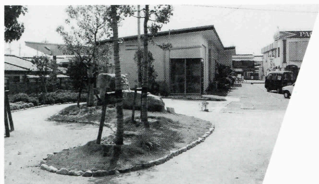
▲みすゞ館資料展示室及周辺整備