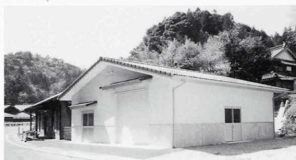
▲坂水地区農業用機械庫 (簡易保険融資施設)