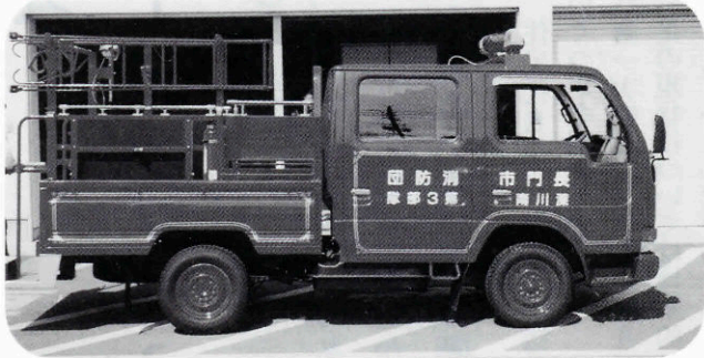
▲小型動力ポンプ積載車（渋木地区）