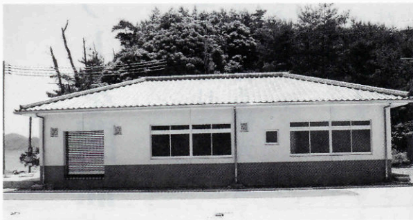
▲大日比地区漁業集落排水処理施設