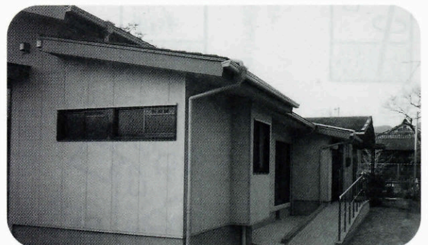
▲仙崎地区老人憩いの家作業棟