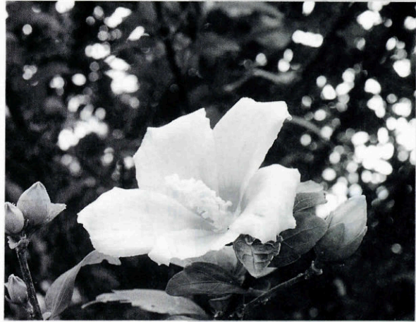
むくげ (アオイ科フヨウ属)

インド・中国の原産で、落葉大低木。庭木・生垣として広く栽培され、夏から秋にかけて一重または八重の淡紫色・淡紅色・白色などの花をつけ、朝開き夜しぼむ。