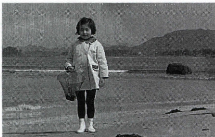
昭和42年ごろ 只の浜にて

いる子供時代を送ったわけ はありませんが、生まれ育っ た18年の間、海が身近な存在 だったことは確かです。ふる さとを想う時、さまざまなき い出が多くのかたし人々 とともに鮮明にのみがえって きます。そしてその背景には BGMのように四季折々の海 の姿があります。 たとえば「大きな波、発見！」 「小さな波、発見」と、姉 やいとこたちと遊んだ遠い日 の海のさざめき。その浜辺