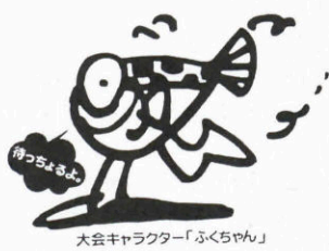
大会キャラクター「ふくちゃん」

いよいよ今月20日(日)、天皇・皇后陛下をお迎えし、仙崎漁港で「第14回全国豊かな海づくり大会」が開かれます。 水産資源の保護や海の環境保全に対する国民意識の向上とともに、海と人のかかわり方を見つめ直し、「豊かな海の創造」を図ることを目的としています。 本市にとって大イベントであり、長門市を全国にアピールする絶好の機会ともいえます。 大会参加者のみなさんに、「来てよかった、もう1度行きたい」といわれるような大会にしたいものです。 市民の皆さんのより一層のご支援、ご協力をお願いします。