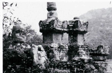
俵山安田にある義尊らの墓

俵山安田に大内義隆の子、義尊ら四人の墓がある。天文二十年(一五五二)、防長を含む七州を支配していた大内義隆と、家臣、陶晴賢との対立は頂点に達した。同年八月末日、晴賢らの軍勢に山口を追われた義隆主従は翌九月一日、大寧寺で討ち死にした。主従ら三十三基の墓が大寧寺裏山の遊仙窟にある。