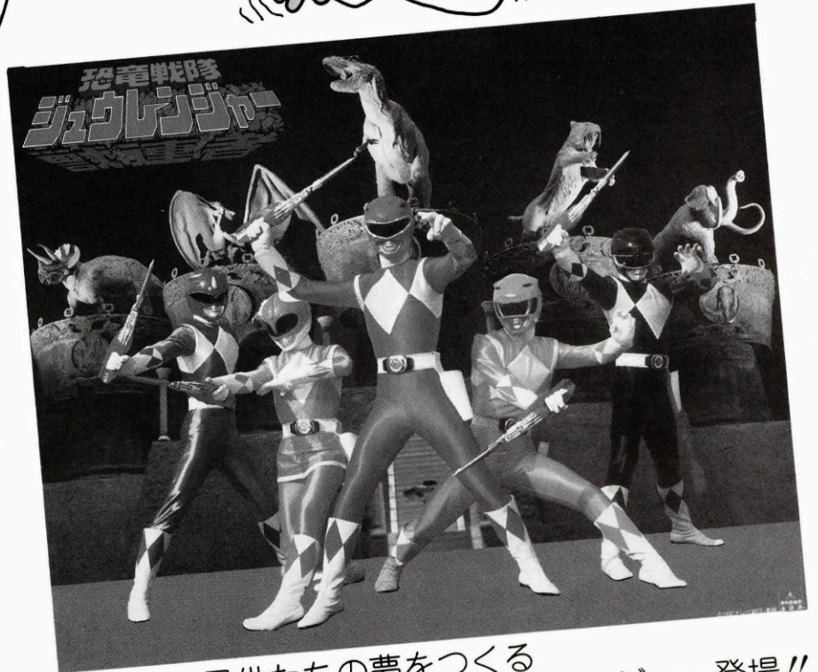
子供たちの夢をつくる 恐竜戦隊ジュウレンジャー登場!!