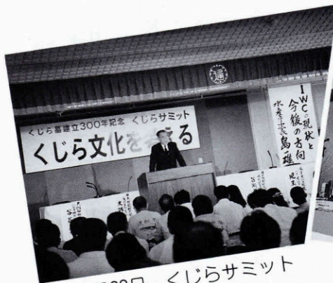
▲ 7月22日 くじらサミット