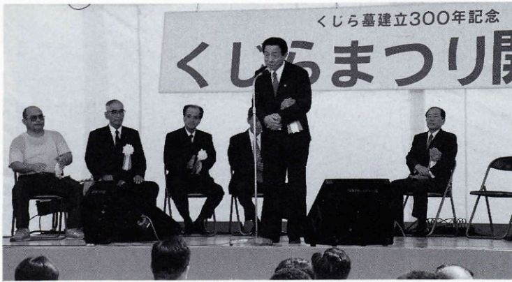
▲ 7月21日 開 会 式