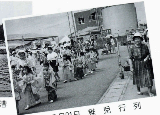
▲ 7月21日 稚 児 行 列