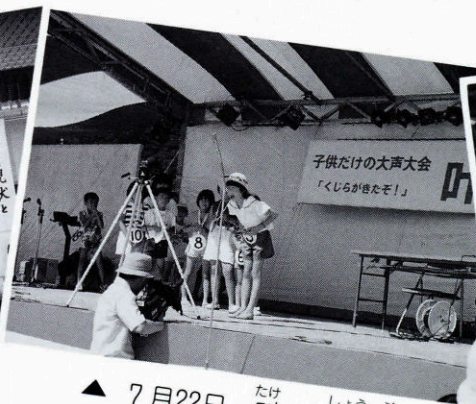
▲ 7月22日 たけしょうが 叫 り 賞 歩