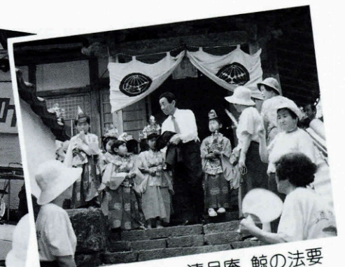
▲ 7月21日 清月庵 鯨の法要