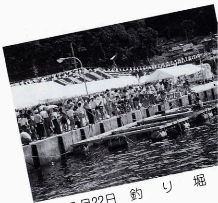
▲ 7月22日 釣 り 堀