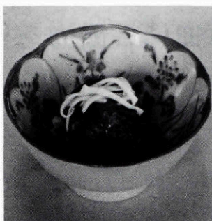
わけぎのぬたあえ