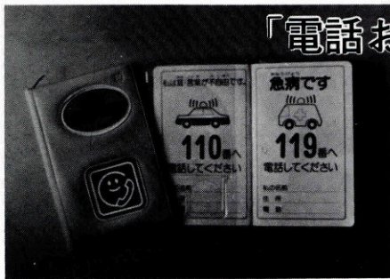
(手帳の贈呈は、NTT長門支店)

この手帳は、耳や言葉の不自由な人が緊急に電話をする必要が出来たとき、この手帳を示して、代わりに電話をお願するものです。もしあなたに、電話お願手帳が示され電話の依頼を受けたら、快く引受け代わりに電話をかけてあげてください。