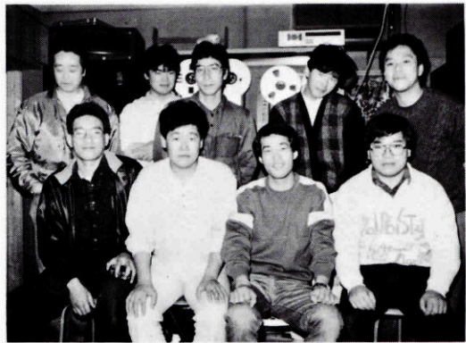
(ブチ音楽企画のスタッフとFストリートのみなさん)

「ブチ音楽企画」は、音楽 好きの11人の若者が集まって 昭和54年に結成されました。 また、この内の6人のメン バーで「ブチ・バンド」をつ くっています。 この「ブチ」は、名前を決 める時、特色を持った方言を とり入れようということ、 そのときブチもめたことに由 来するとか。 情報・文化の過疎地とも言 えるこの長門市に、音楽を定 着させるため、設立にあたり 3つの目標を掲げました。 その一つが「ブチ・バンド」 のコンサートを開くこと。 つぎに、レコードコンサー トを開くこと。 三つ目が、プロの歌手のコ ンサートを開くことです。 今までに、「ブチ・バンド」