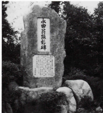
金左衛門顕彰碑(三上山)

キロ、田屋原にひく、途方もない企てである。彼は綿密な計画をたて、資材などの援助を領主に願い出たがいられなかった。