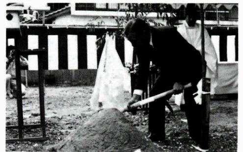
▶ 九月五日 起工式