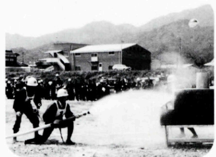
△消防団員による操法競技