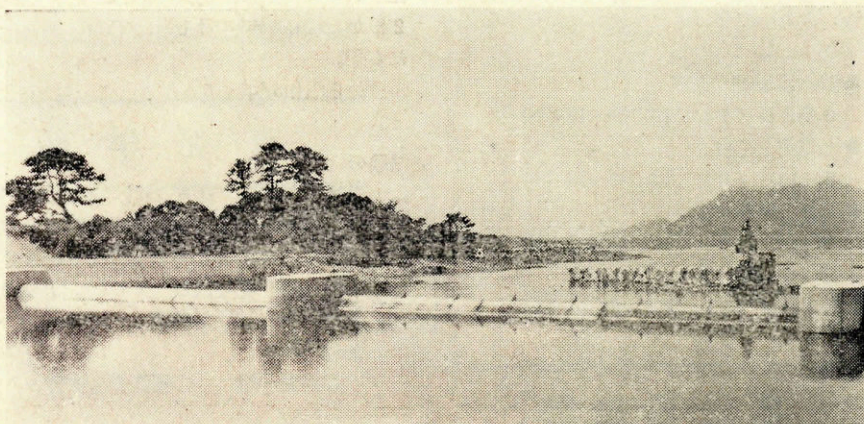
▲深川川に完成した河口堰