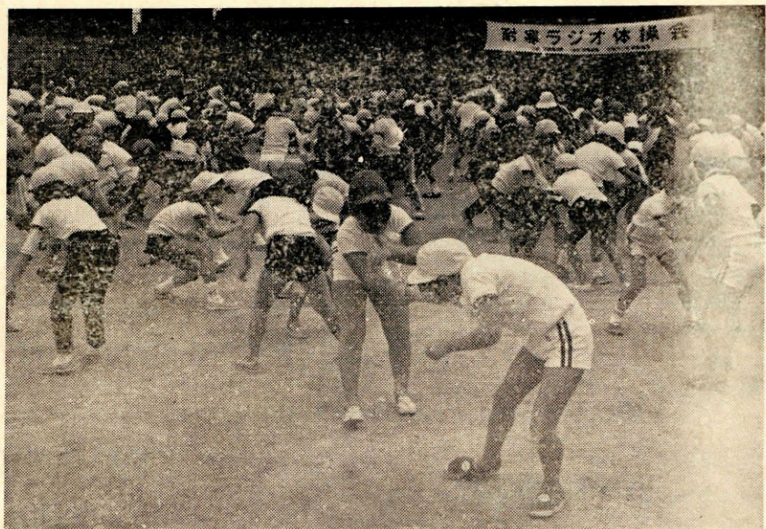
耐寒ラジオ体操 (仙崎小グラウンドにて)

「寒さにちぢこまったからだを、体操で思いきりのぼさう。」と耐寒ラジオ体操会が開催されました。2月4日午前9時、会場の仙崎小学校グラウンドには、小・中学生と一般市民の1300人が集まりました。この催しは、中国郵政局などが毎年管内1か所を指定して開いているものです。今年は体力づくりモデル市に指定された長門市が選ばれました。あいにくこの日は、いまにも降りだしそうな空模様でした。第1・第2ラジオ体操のほかに、二人が組になつておこなうなかよし体操やマラソンで、いい汗を流しました。