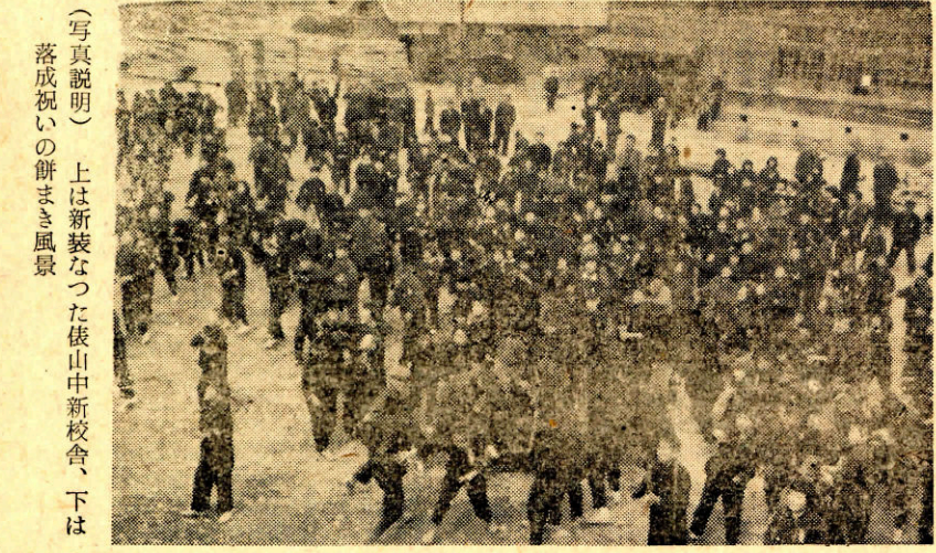
(写真説明) 上は新装なつた俵山中新校舎、下は落成祝いの餅まき風景