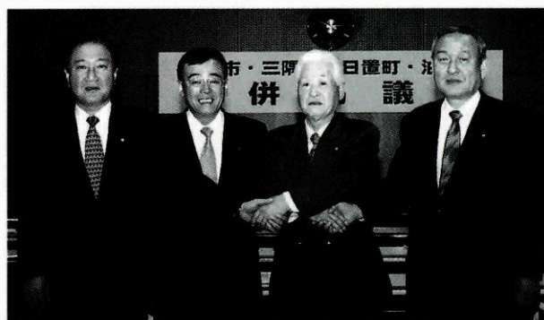
▲最後の合併協議会を終え、握手する1市3町の首長

議で選任していただいたが、その重責に身の引き締まる思いです。新市長が誕生するまでの間、市政に停滞を招かないよう、職員とともに精一杯がんばって職責を果たしたい」とあいさつしました。