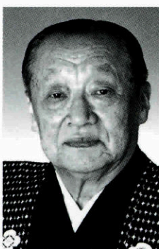
義太夫 竹本住大夫