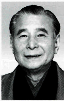
落語 桂 米朝