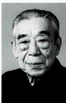
狂言 茂山 千作