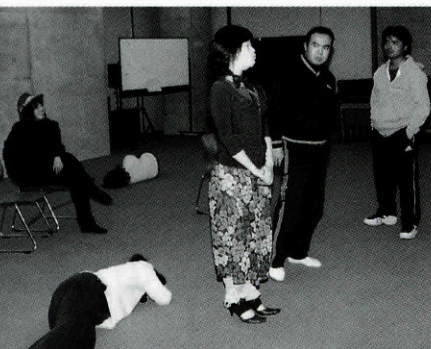
本番に向けて練習にも熱が入ります

の平均年齢。遠方からの参加者や 仕事の都合などで全員そろおうこと が困難等々、不安は尽きませんが、 目前に迫った旗揚げ公演に向け、 日々稽古に励んでいます。 2月12日(土) 15:30 ルネッサながと劇場(入場無料) 「地下で待つドラえもん」 ぜひ観にいらしてください。お 芝居をもっと身近に感じていただ けたら幸いです。