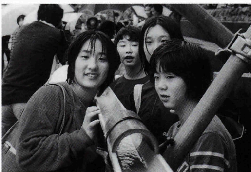
10月10日、1200mソーメン流しのゴールにて

10月10日に大畑小学校の創立120周年を記念して1200メートルソーメン流しが行われました。この日のために5月からお父さんたちが計画を立て、測量をし、竹を切り、組み立て、調節などしていました。雨の日でも、カップを着て一生懸命がんばっていました。 ソーメン流しの当日、私は小学生代表でソーメンを流しました。流すとき、学校までたどりついてくれるようにと気持ちをこめて流しました。 そして、学校のゴールで、みんなといっしょにソーメンがたどりつくのを今か今かと待っている2センチ位の小さなふやけたソーメンがたどりついてき