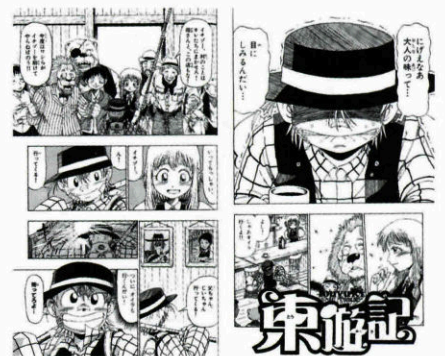
週間少年サンデーに連載中の作品「東遊記」

多く出てきます。長門のような自然をうまく表現できたらと思います。ただ戦ったりすることが多い漫画なので自然を壊すこともありますが…実際の長門の自然は永く残っていて欲しいものです。 また休みに長門へ帰るのを楽しみに、がんばって漫画を書きたいと思っています。