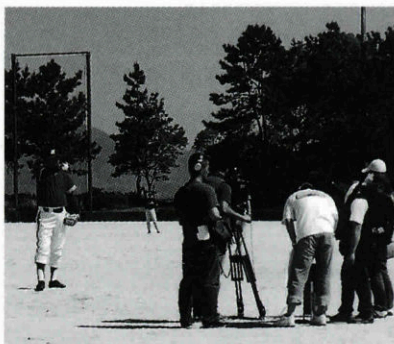
小河内グラウンドでの収録の様子

「出演を決めたときは軽い気持ちだったけど、撮影が進むにつれて収録された内容は6月30日（水）の番組で放送される予定です。