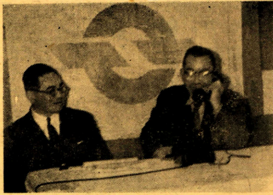
【喜るこびの初通話する市長】

る十二日、午後十時を期して 行なわれました。 長門電報電話局では、電話 は必ず番号で呼んで、屋号や