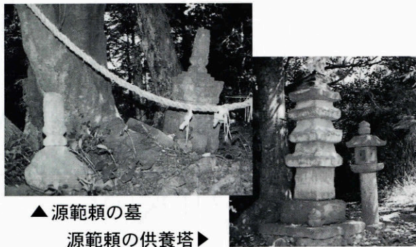
▲ 源範頼の墓 源範頼の供養塔 ▶

三隅町生島の下に蒲ノ台というところがあり、源範頼の供養塔と伝えられる古墳（四重層塔）がある。源範頼の別名「蒲の冠者」に因みこの付近は「蒲」といわれた。