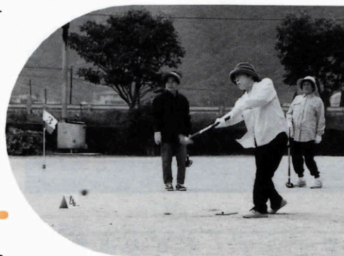
◀ ホールインワンかも？ グラウンドゴルフ