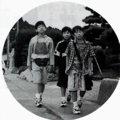
▲ ウォークラリー 元気を出して 出発だ～