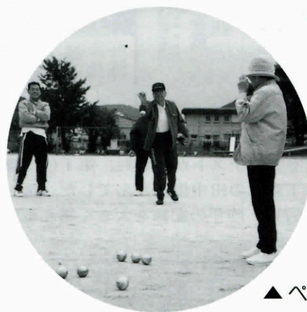
▲ ペタンクー発逆転？