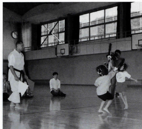
▲ スポーツチャンバラ えい！