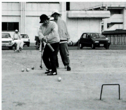
◀ ゲートボール 通れ！ 通れ！