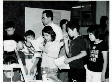
ホテルサークル “シグナル”の研究発表