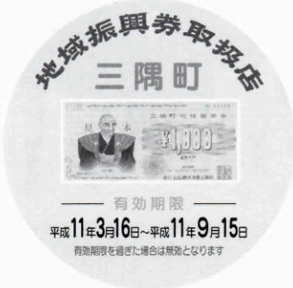
取扱店ステッカー