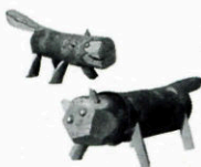
香月泰男のおもちゃ「虎」 三隅町立香月美術館