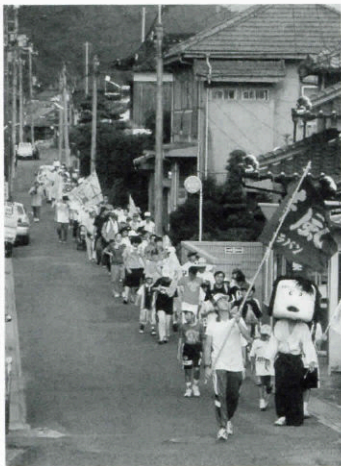
市をぬけるとゴールは目前

軽い気持ちで参加しましたが、思っていた以上に大変でした。無事ゴールできて、うれしく思っています。できれば、来年もチャレンジしたいですね。